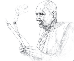
กต. พญ. พญ. พญ.

พระพุทธศาสนสุภาษิตที่มีมาในบุญญสูตรนี้ ตรัสสอน ให้ทุกท่าน ทุกบุคคล ผู้ใคร่ประโยชน์ ศึกษาบุญอันเป็นส่วน เหตุให้เกิดผลเลิศต่อไป มีสุขเป็นกำไร เป็นเหตุให้เกิดความสุข คือให้เจริญทาน สมจรรยา ความประพฤติสงบ และเมตตาจิต รวม ๓ ประการ