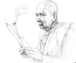
ศต. พญามหาอโศ

ย่อมบันเทิงในโลกทั้งสอง เขาเห็นความบริสุทธิ์แห่งกรรมของ คนย่อมบันเทิง ย่อมบันเทิงทั่ว”