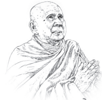
ภค. พญ. พญ. พญ.

หรือไม่ควรเลือกทำแต่กุศล ควรต้องทำทั้งบุญและกุศลควบคู่กันไป จึงจะสมบูรณ์ เหมือนกินข้าวแล้วก็ต้องกินน้ำ ไม่เช่นนั้นจะไม่รู้สึกรู้ว่าเพียงพอแล้ว กินแต่ข้าวไม่กินน้ำไม่เรียกว่าบริโภคอาหารอิ่มเรียบร้อย ต้องกินทั้งสองอย่างเรียบร้อย จึงเรียกว่าบริโภคอาหารมีอันเสร็จเรียบร้อย ทำบุญจึงต้องทำกุศลด้วย