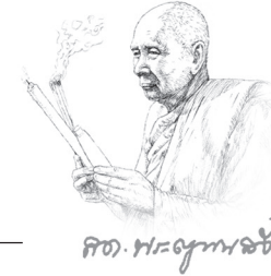
ศต. พญามหาลอ