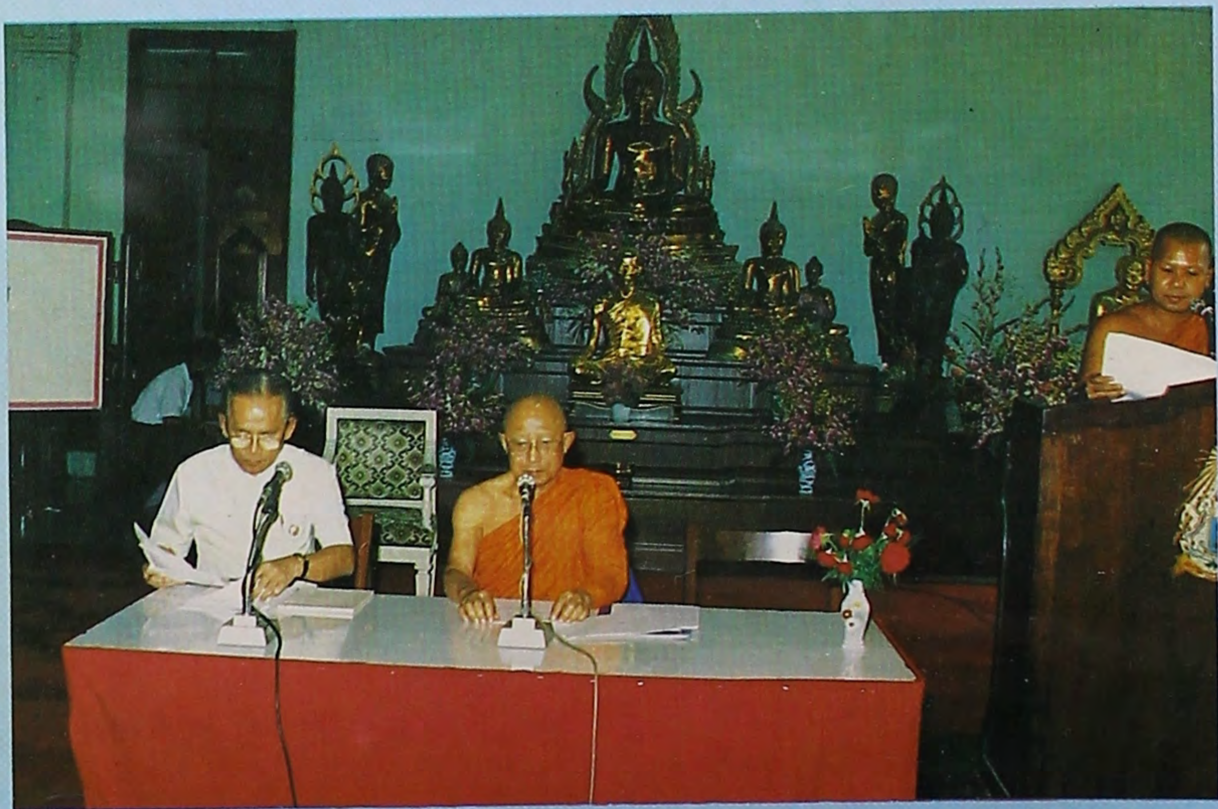
พระพุทธรังษณี กรรมการมหาเถรสมาคม เจ้าคณะใหญ่หนเหนือ เจ้าอาวาส วัดเบญจมบพิตร เป็นประธานในการประชุมใหญ่เพื่อพิจารณารายงานการประชุมกลุ่ม