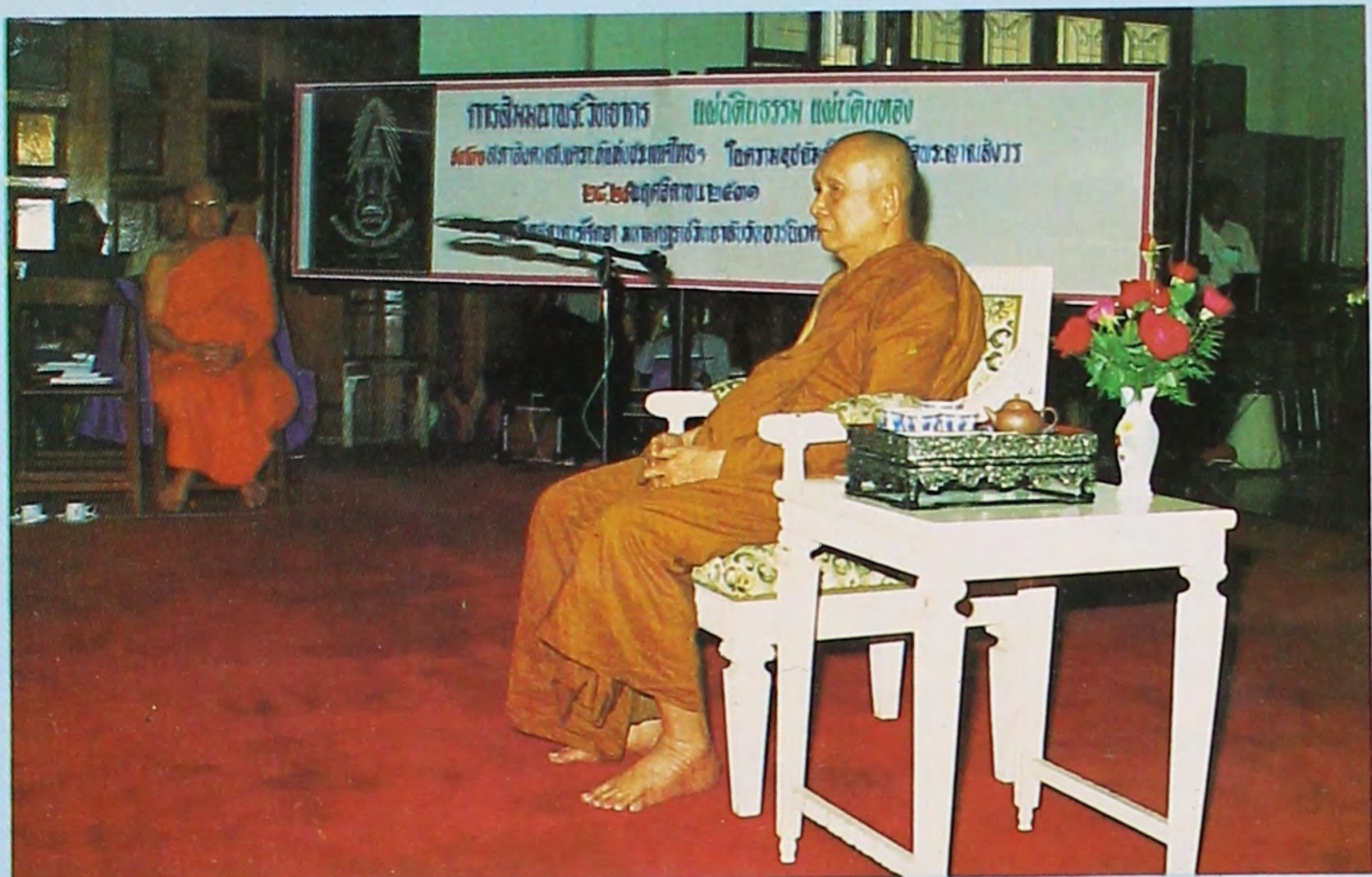
สมเด็จพระญาณสังวร เป็นประธานในพิธีเปิดการสัมมนาพระวิทยากรแผ่นดินธรรม แผ่นดินทอง วันที่ ๒๗ พฤศจิกายน ๒๕๓๑ ณ ตึกสภาการศึกษา มหาวิทยาลัยมหามกุฏราชวิทยาลัย